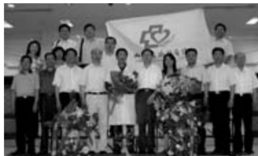
医院第一批抗震救灾医疗队从四川凯旋