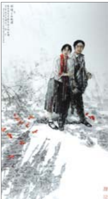
蔡玉水《刑场上的婚礼》