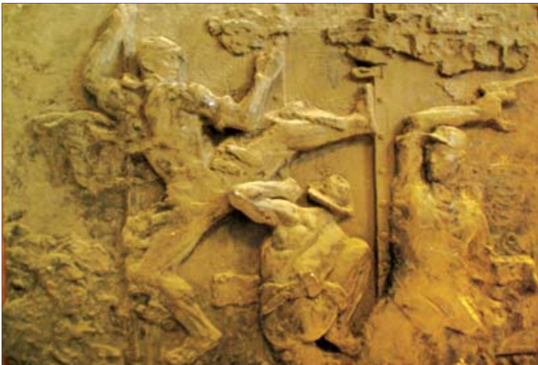
池清泉《铁道游击队》