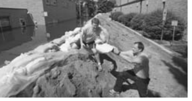
右图：在北达科他州迈诺特市，两位居民在修筑临时防洪设施。