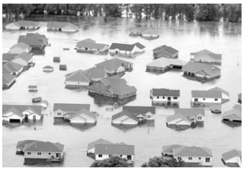
上图：6月25日，在美国北达科他州迈诺特市，一些新建的房屋被淹在洪水中。