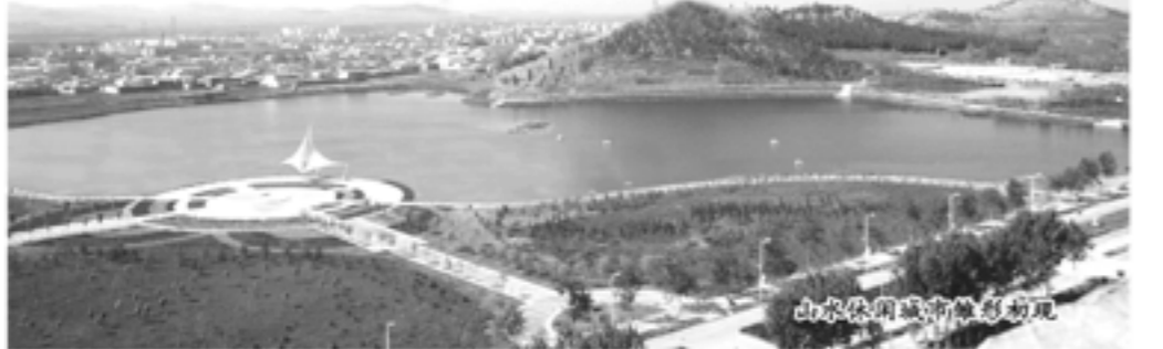
山水休闲城市新面貌初现