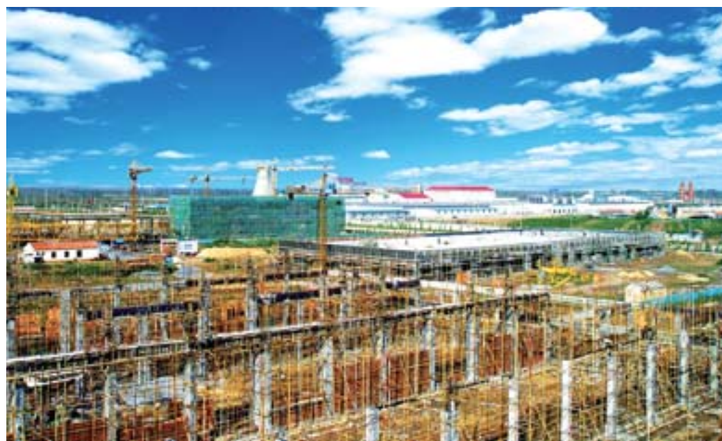
建设中的高青经济开发区

2009年11月23日，黄河三角洲高效生态经济区规划上升为国家战略。作为淄博市唯一划入该规划的区县，高青县迎来了加快发展的历史性机遇。按照“高效生态”的发展目标，提出了“一园三基地”的功能定位，努力建设淄