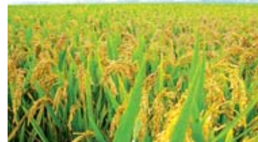
高青大米

精细加工，树品牌。公司投资2160万元从日本引进了世界上最先进的佐竹精米加工设备，采