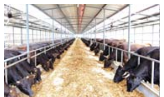
繁育中的山东黑牛

总投资5.1亿元建设的山东黑牛标准化养殖基地是10万头山东黑牛繁育及产业化开发的核心工程。项目总建筑面积36.5万平方米，包括良种繁育、育肥、犏牛养殖、多功能饲料生产加工、沼气发电与有机肥加工、生态种植等七大功能板块。落户基地的大地肉牛清真食品股份有限公司是集饲料加工、肉牛繁育养殖、屠宰、精细