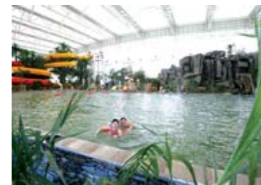
大型室内温泉游泳池