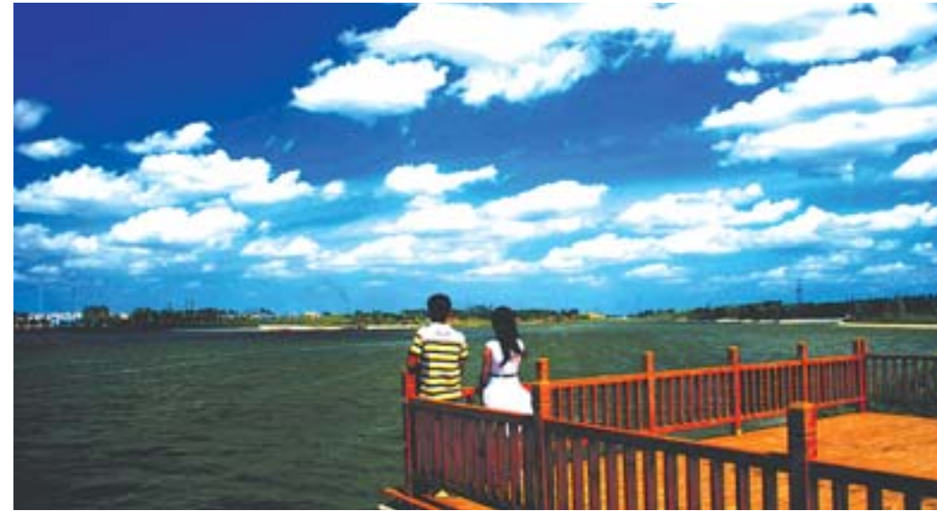
高青千乘湖生态文化园