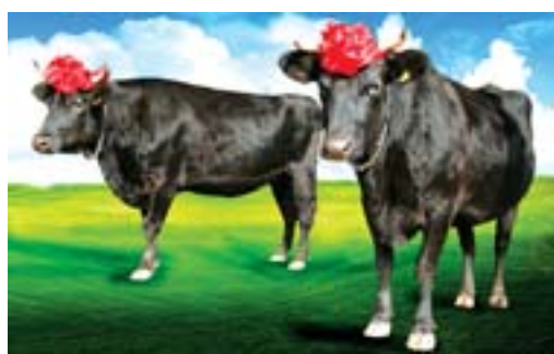
我国首例和第二例体细胞克隆牛“康康”和“双双”

加工、高档排酸牛肉冷藏销售为一体的省级重点龙头企业。目前，公司年屠宰加工肉牛能力达6万头，被分割高档优质排酸鲜牛肉产品达108个，产品质量达出口中东与欧盟标准。