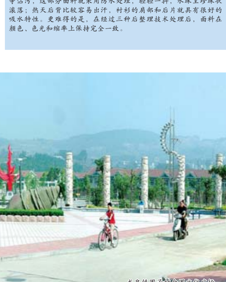
鲁泰集团齐泰合园农展馆