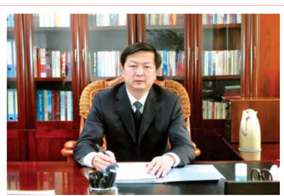
中共淄川区委副书记、区长 李新胜