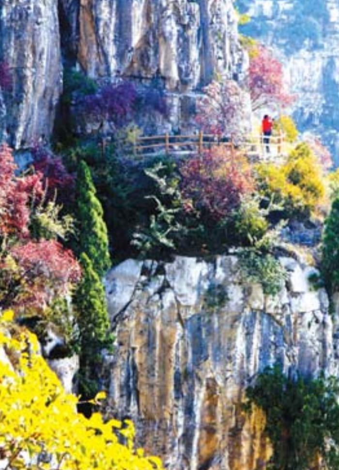
位于城庄国家森林公园内的潭溪山风光