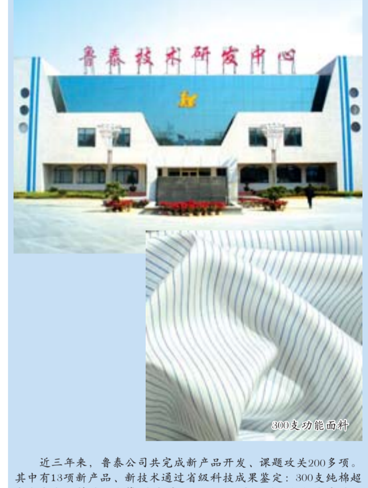
鲁泰技术研究中心