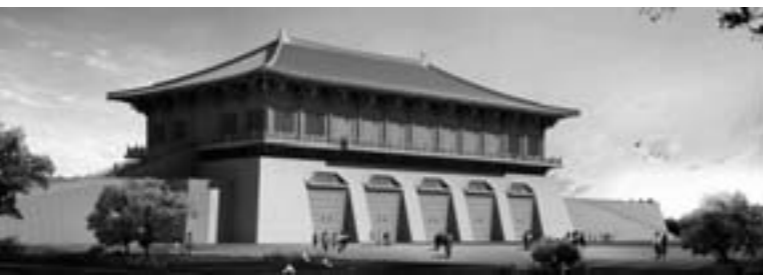
丹凤门保护展示工程方案