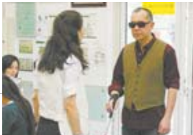
● 电影《不再让你孤单》剧照

□ 记者 于国鸣 报道 本报讯 刘伟强导演的爱情电影《不再让你孤单》,将于5月20日上映,黄秋生在影片中出演一位酒吧盲老板。3月28日,影片出品方博纳影业、寰亚电影公布了一部分黄秋生剧照,从中可以看到其扮相颇有盲人神韵。据介绍,黄秋生在片中还当起了“红娘”,为舒淇、刘烨两位主角的爱情牵线搭桥。