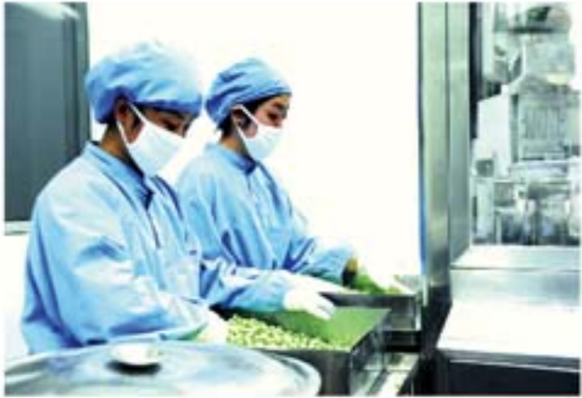
尽心尽责保证品质