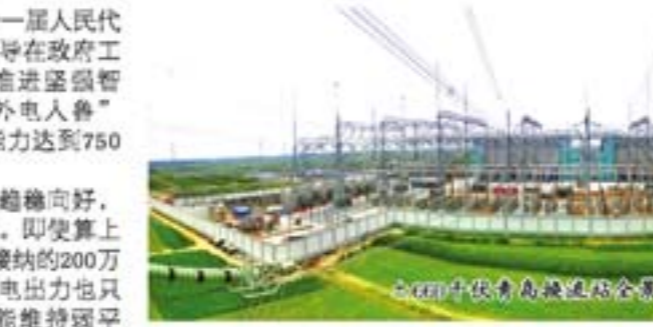
继续保持高位运行态势。

我省是全国的能源需求大省,在从经济大省向经济强省跨越的过程中,一次能源相对短缺的省情需要巨大的能源支持,仅靠省内就地平衡已经难以满足全省经济快速发展的需要。“十二五”期间,我省将进一步加大经济发展方式转变力度,全省经济社会进入转型升级期,经济总量平稳较快增长的态势将持续较长时间,电力供需