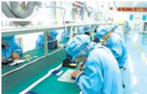
蓝晶易碳太阳能电池板生产线