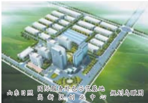
山东日照国际服务外包示范基地 规划鸟瞰图 高新区创业中心

十年来,在日照市委、市政府的正确领导下,东港区委、区政府以科学发展观为统领,凝心聚力,干事创业,举全力加快日照高新区建设,走出了一条跨越发展之路;今年以来,日照高新区党工委、管委,按照东港区委、区政府“一区四园三带”的规划布局,立足新起点、新平台,再创新业绩、新辉煌,步入跨越发展快车道,奋力冲刺国家级高新区!