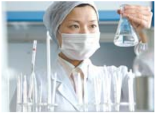
山东洁品药业有限公司化验室