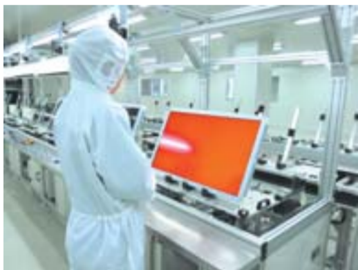
海帝电器液晶电视生产现场