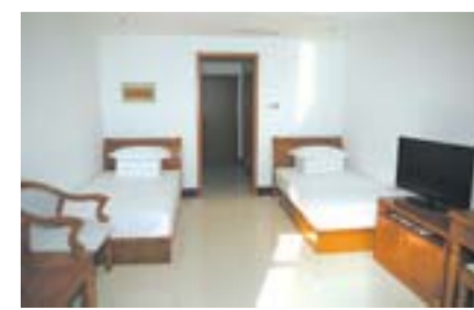
设施齐全的职工公寓