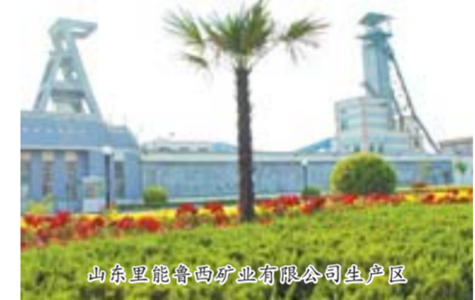
山东里能鲁西矿业有限公司生产区

齐心协力,大力建设节约、循环、生态型煤矿。该矿从实际情况出发,以优化资源利用为核心,以节能、节水、节材、节约人力资源为重点,发扬“实