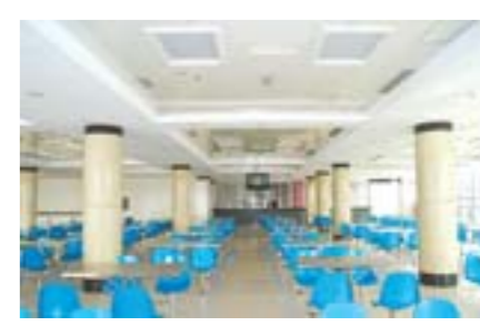
温馨舒适的职工餐厅