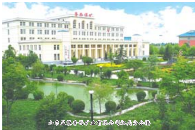
山东里能鲁西矿业有限公司机关办公楼

山东里能鲁西矿业有限公司(山东省鲁西煤矿)位于山东省济宁市任城区廿里铺镇境内,拥有井田面积54.4平方公里,设计生产能力45万吨/年,核定生产能力87万吨/年。 多年来,在上级党委及有关部门的正确领导下,该矿认真贯彻落实科学发展观,严格管理,狠抓落实,连续实现煤矿安全生产和经济效益双丰收。在刚刚过去的2010年,该矿实现销售收入3.85亿元,实现利润1.5亿元,实现利税2.2亿元,未发生重伤以上安全事故,百万吨死亡率为零。企业连续七年保持了“A”级安全矿井称号,连续六年保持了“通风示范化矿井”称号,连续四年保持了“省级文明单位”称号,还被授予“全国煤炭工业十佳煤矿”、“全国煤炭工业安全高效矿井”、“山东省煤炭工业十佳煤矿”、“双基建设省级先进单位”、“安全质量标准化一级矿井”等荣誉称号。