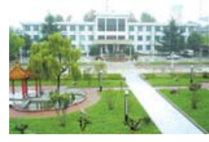
环境优美的办公场所