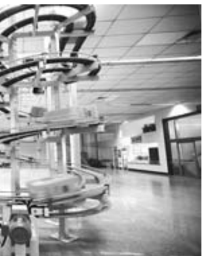
企业文化建设运行