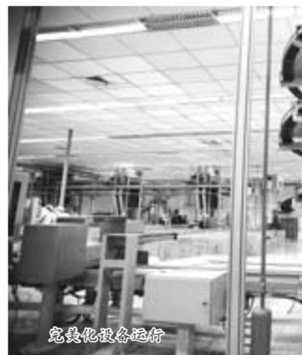
企业文化建设运行